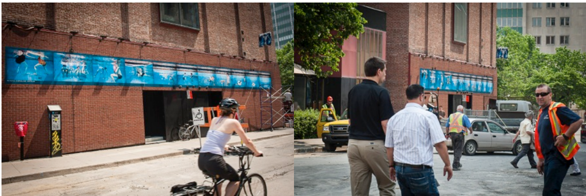
Rue Saint-Urbain, mur ouest du Théâtre du Nouveau Monde, 2011

Inspirée des techniques utilisées par Publicité Sauvage, la murale grand format NIVEAU_LEVEL représente, au travers d'une série de onze photographies, une métaphore de la lente décrue de l'eau au fil des générations. Quoi de plus commun dans notre société nord-américaine qu'une piscine? Notre corps, extirpé d'un bassin, retrouve le plaisir de l'eau dans la baignade.